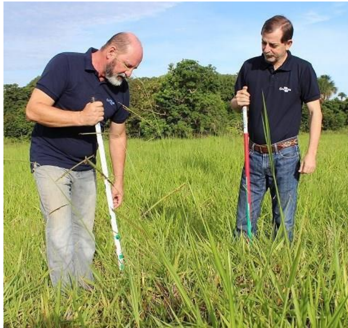
Figura 1. Medição da altura do pasto com régua.

Essa previsão deverá ser usada para definir o período de ocupação do piquete em uso e assegurar que o término do pastejo em um piquete coincida com o início do pastejo no próximo piquete e assim sucessivamente. Utilizando-se dessas recomendações espera-se um ganho de peso diário dos animais entre 650 e 800 g (média geral das forrageiras no período das águas). A taxa de lotação depende do acúmulo de forragem no período e deve se manter sempre em amplitude ótima de pastejo (Gráfico 2.)